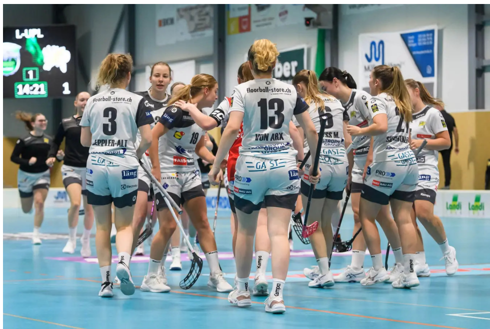
Die Spielerinnen von Burgdorf Wizards bejubeln einen Treffer.